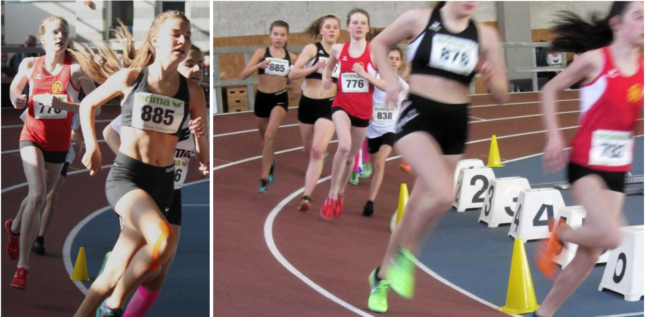
800m Lauf der WU16